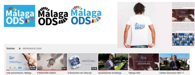
Comunicación de los ODS en Málaga

Estas son algunas de las acciones realizadas por la Fundación CIEDES para alinear los ODS con la vida municipal. Seguir trabajando en esta línea, pensando qué instrumentos de comunicación debe utilizarse según los públicos objetivos a los que se quiera llegar, es una tarea en la que hay que seguir trabajando. Material audiovisual, redes sociales, medios de comunicación tradicionales, charlas, talleres temáticos, todos y cada uno son elementos fundamentales para impregnar la vida diaria con los principios que defienden los ODS y gracias a la comunicación conseguir hacer entre todo un mundo mejor en el que nadie se quede atrás.